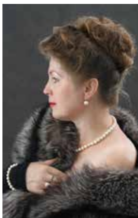
Народная артистка России, лауреат премии фонда Ирины Архиповой Вера ДОБРОЛЮБОВА (сопрано)