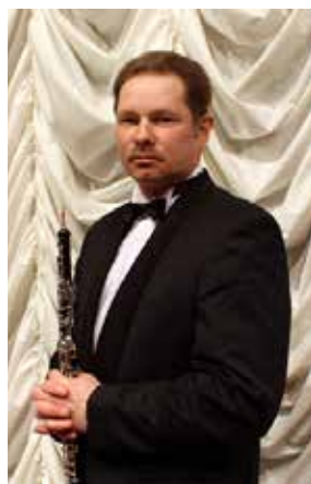
Заслуженный артист России Сергей ДОБРОЛЮБОВ (гобой)