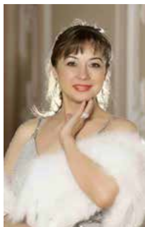
Заслуженная артистка России Галина СИДОРЕНКО (меццо-сопрано) г. Санкт-Петербург