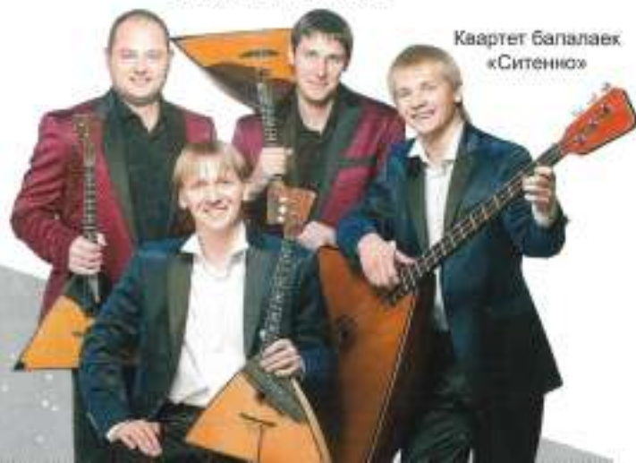
Квартет балалаек «Ситенно»

В исполнении солистов Ивановской государственной филармонии прозвучат русские народные песни, старинные романсы, популярные песни советской эпохи и современные шлягеры